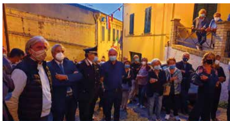
Il pubblico intervenuto all'inaugurazione