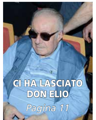
CI HA LASCIATO DON ELIO Pagina 11