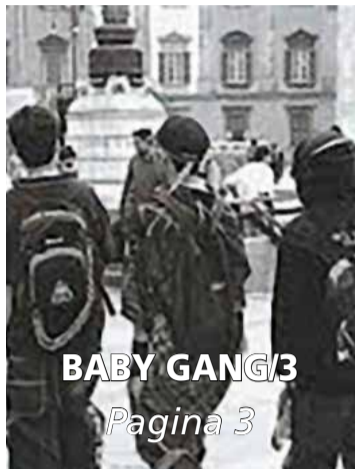
BABY GANG/3 Pagina 3