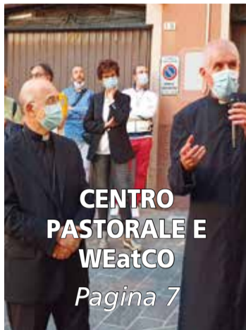
CENTRO PASTORALE E WEatCO Pagina 7