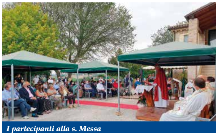
I partecipanti alla s. Messa

A questo punto le Opere si sono interrogate sul proprio