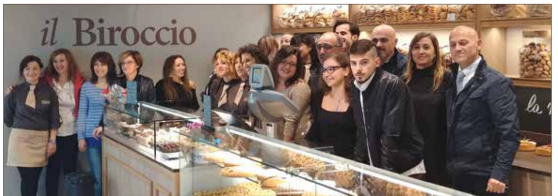
Il Biroccio soc. coop a.r.l. - Uffici panificio pasticceria e punto distribuzione - Via Oberdan, 63 - 60024 Filottrano Punto vendita: Via Tornazzano, 122 - Tel. 071 7222790 - Fax 071 7226070 Albo Cooperative mutualità prevalente n. A107219 - www.ilbiroccio.com - info@ilbiroccio.com

Il Papa ci ricorda la responsabilità che abbiamo verso le generazioni future con un invito ad agire con speranza, coraggio e volontà, prendendo decisioni concrete. Non possono essere rimandate a domani, se hanno come fine quello di proteggere la casa comune e la dignità di ogni essere umano. «Si deve consumare per vivere, non vivere per consumare», mai si deve consumare sfrenatamente, come accade oggi. Ognuno deve usare della terra ciò che serve al proprio sostentamento. Tutto è collegato, dobbiamo avere una comune preoccupazione: guardare che l'ambiente sia più pulito, più puro e si conservi. E prenderci cura della natura, affinché essa si prenda cura di noi. È necessario "un reale cambiamento di rotta", "una nuova coscienza del rapporto dell'essere umano con sé stesso, con gli altri, con la società, con il creato e con Dio". I giovani ci stanno dando dei segnali forti, non c'è più tempo di aspettare, bisogna agire.