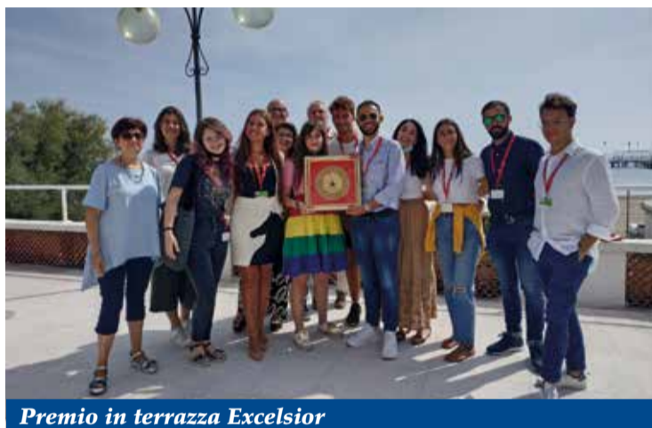
Premio in terrazza Excelsior