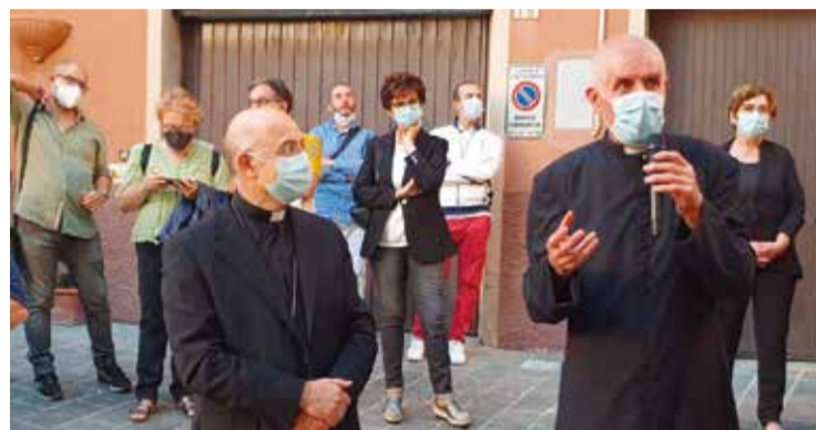
L'Arcivescovo Angelo e Don Bruno

tà, quindi grazie, veramente di cuore, don Bruno”. Poi parlando di “WEatCO” l'Arcivescovo ha aggiunto che quando i componenti dell'ufficio per la pastorale sociale e del lavoro sono andati da lui per parlare di questo progetto hanno incontrato in lui