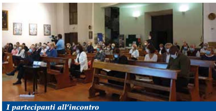
I partecipanti all'incontro