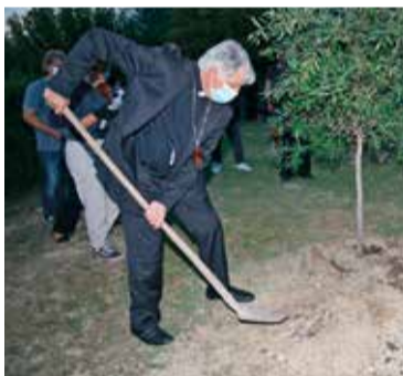
Il Cardinale e l'Arcivescovo piantano l'ulivo

cammino di vita, di recupero e di serenità; perché è possibile ritornare alla vita solo quando i fratelli si amano sotto il grande cielo di Dio che è amore. Ma questa casa è anche un punto di riferimento e di grande pedagogia per tutta la Comunità, perché qui noi impariamo che cosa sono la carità e la vicinanza e perché qui noi, soprattutto i ragazzi e le nuove generazioni, impariamo ad avere cura di noi stessi, per avere una salute piena e buona." Dopo la celebrazione c'è poi stato il momento della convivialità con una cena che ha sancito anche l'apertura di una nuova campagna di raccolta fondi chiamata "Fuori di casa" per l'acquisto di una nuova automobile per gli ospiti del Focolare: una parte del costo della cena è andato proprio a favore di questa raccolta cui ovviamente tutti sono chiamati a contribuire (per scoprire come fare visitate il sito www.ocfmarche.it in cui vengono riportate tutte le modalità per fare una donazione).