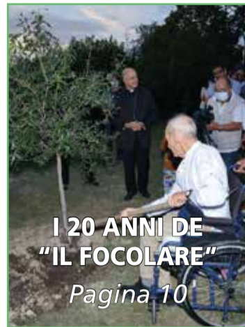
I 20 ANNI DE "IL FOCOLARE" Pagina 10