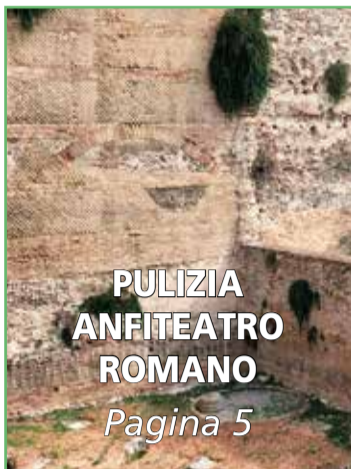
PULIZIA ANFITEATRO ROMANO Pagina 5